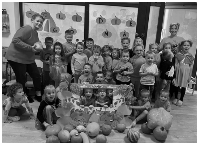
Moliūgo diena

• Rugsėję darželyje vyko Pasaulio tvarkymo diena. Vaikai tvarkė savo aplinką. Domėjosi, kodėl yra svarbu ne tik palaikyti tvarką savo kambary, bet ir rūpintis pasaulio švara, kad visiems gera būtų gyventi švarioje aplinkoje.