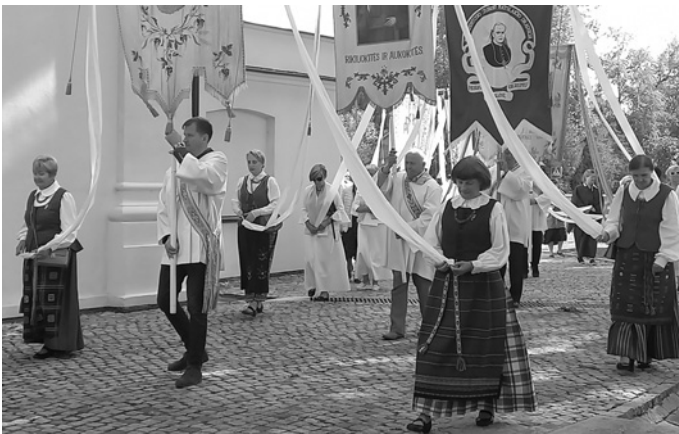
Atlaiduose Marijampolėje