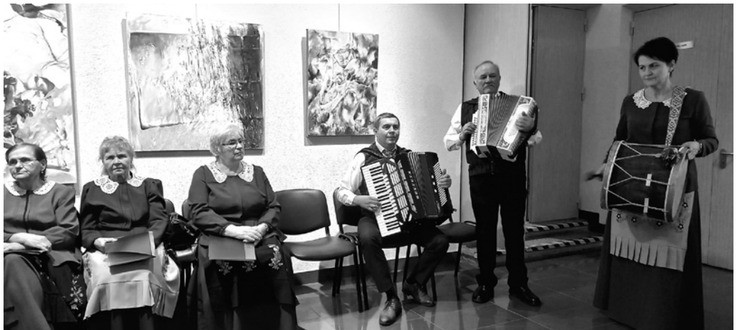
Suvalkiečiai prie Prienų ir Birštono krašto menininkų darbų