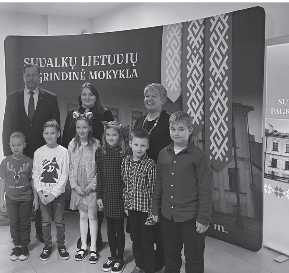
Švenčiant pirmąjį Suvalkų lietuvių pagrindinės mokyklos gimtadienį

Nors tai tik pirmas žingsnis ilgame kelyje, jis jau tapo tvirtu pamatu, ant kurio statysime ateities pasiekimus ir svajones. Linkime, kad kiekvienas iš mūsų rastų įkvėpimą, siektų savo tikslų ir prisidėtų prie dar gražesnės mokyklos ateities.