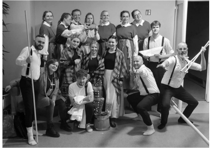
„Sūduva“ Birštone