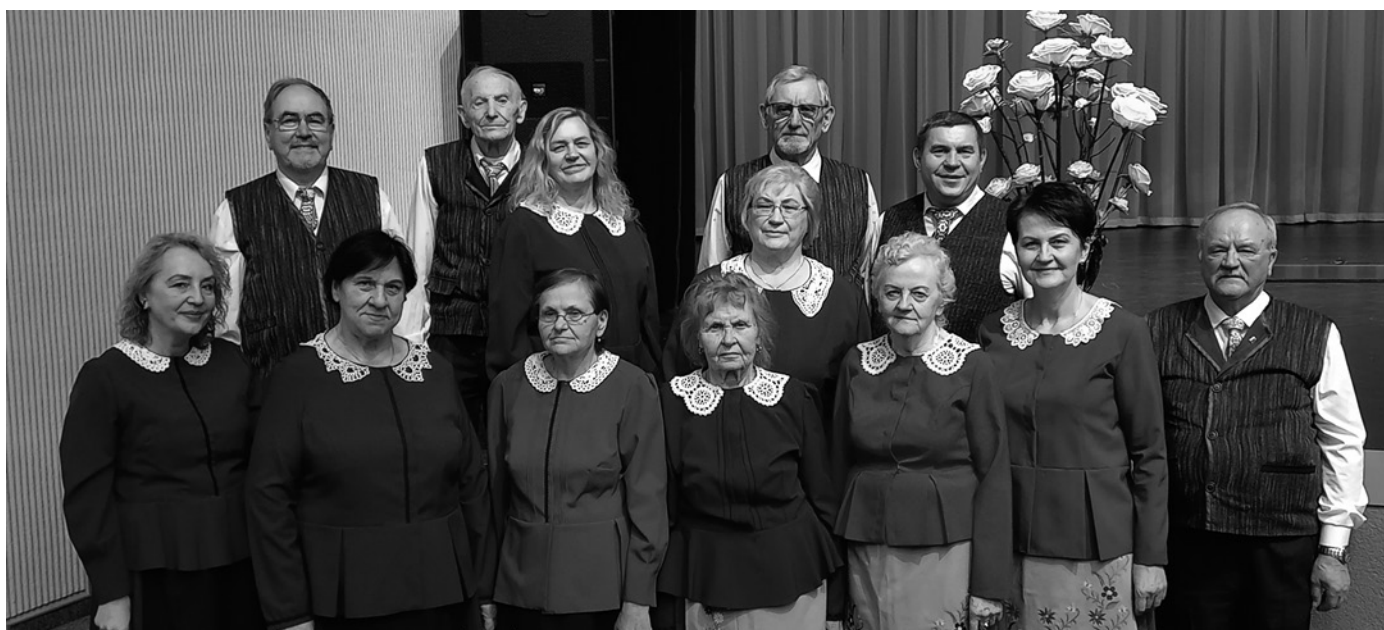
„Ančia“ Prienų kultūros ir laisvalaikio centre

energija uždega ir telkia dainininkus. Kiekvienas susitikimas ansamblietėms virsta mažyte džiaugsmo švente. Galbūt todėl kolektyvo kūrybinis kelias yra toks spalvingas ir įvairus, jame – ne tik nuolatinės repeticijos, bet ir festivaliai, konkursai, koncertai, o šiame procese lydi neišsenkantis pareigos jausmas ir noras siekti profesionalumo.