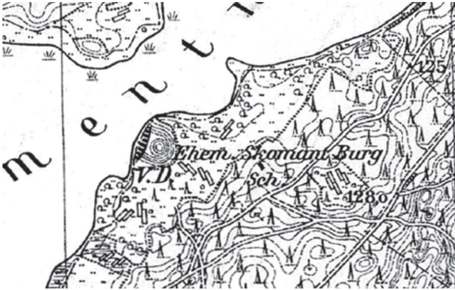
Antrasis Skomantų piliakalnis (vok. Skomant Burg) vokiečių topografiniame žemėlapyje „Topographische Karte 1:25000“ (Messtischblätter)

vandens lygis sumažintas. Dėl šio proceso išplėsta žemės ūkyje naudojamų pievų teritorija. Senajame topografiniame žemėlapyje yra informacija apie šioje teritorijoje vykdytą durpių gavybą. Pietinis šlaitas yra nedidelio nuolydžio,