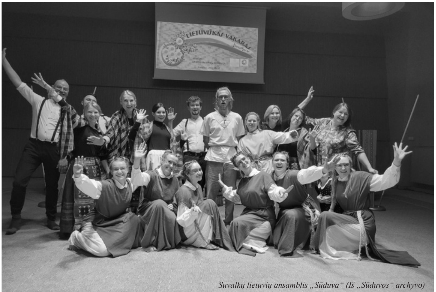
Suvalkų lietuvių ansamblis „Sūduva“

LIETUVOS RESPUBLIKOS UŽSIENIO REIKALŲ MINISTERIJA