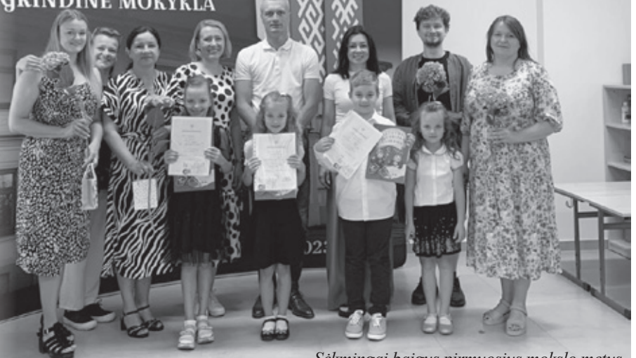
Sėkmingai baigus pirmuosius mokslo metus