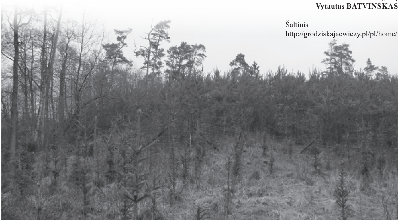
Jaunuolynas ant antrojo Skomantų piliakalnio