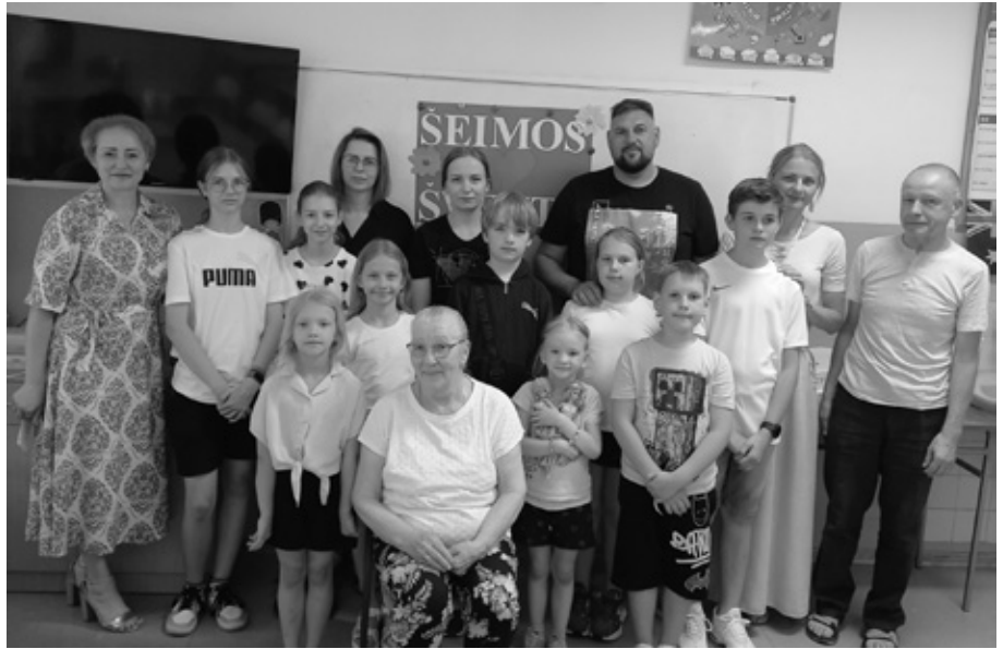
Šeimos šventės dalyviai

Mokiniai, visad drąsūs ir žvalūs, labai jaudinosi prieš pasirodymą, bet puikiai išmokę savo eiles kuo gražiausiai pasirodė mylimiausiems žmonėms. Eilėraščiai paprasti, vaikiški, bet labai aiškūs ir suprantami. Vaikai išsakė savo jausmus ir išreiškė didelę padėką tėveliams.