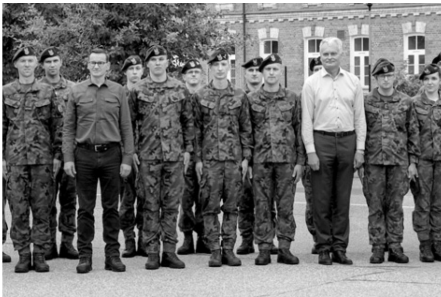
Lietuvos prezidentas G. Nausėda ir tuometinis Lenkijos premjeras M. Morawiecki Suvalkuose. 2023-08-03

Išrinktasis Prezidentas G. Nausėda bus prisaikdintas liepos 12 d., po sugrįžimo iš NATO posėdžio Jungtinėse Amerikos Valstijose. Jis nesiruošia itin iškilmingai antrosios kadencijos inauguracijai, atrodo, priėmimo Prezidentūros kiemelyje dalyvaus visuomenė. Karas Ukrainoje, kibernetinės atakos, intensyvėjantys valstybinių sienų nelegalūs kirtimai, artėjantys JAV Prezidento rinkimai kelia didžiulę įtampą ne tik Europoje.