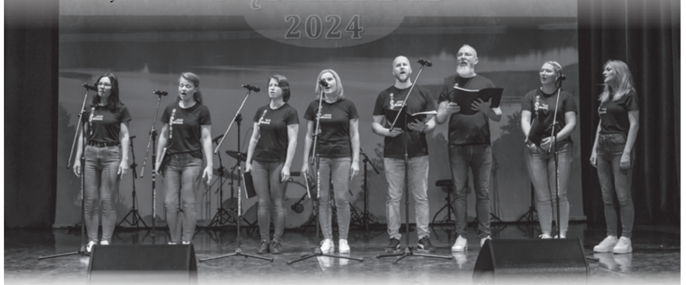
Lietuviškų ansamblių sąskrydyje

Šie metai ypatingi mėgėjų meno atstovams – Lietuvos dainų šventės švenčia 100-metį. Teatro dienoje dalyvaus ir „Sūduvos“ teatras bei